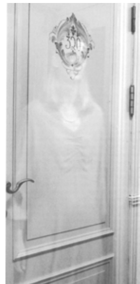
DR. HOLMS: Fornemt møtested i generasjoner. Den grå damen ses på døra.

DR. HOLMS HOTEL på Geilo ble åpnet samtidig med Bergensbanen i 1909, som kursted. Et nygift par på bryllupsreise tok i 1926 inn på rom 320. En kveld tar den unge fru en ektemannen på fersken på rommet med en stuepike. Noen dager seinere blir hun funnet hengende fra en takbjelke på loftet over rom 320. Etter dette begynner ting å skje, opplevd av både ansatte og gjester: Et gammelt veggur som ikke hadde virket på mange år,