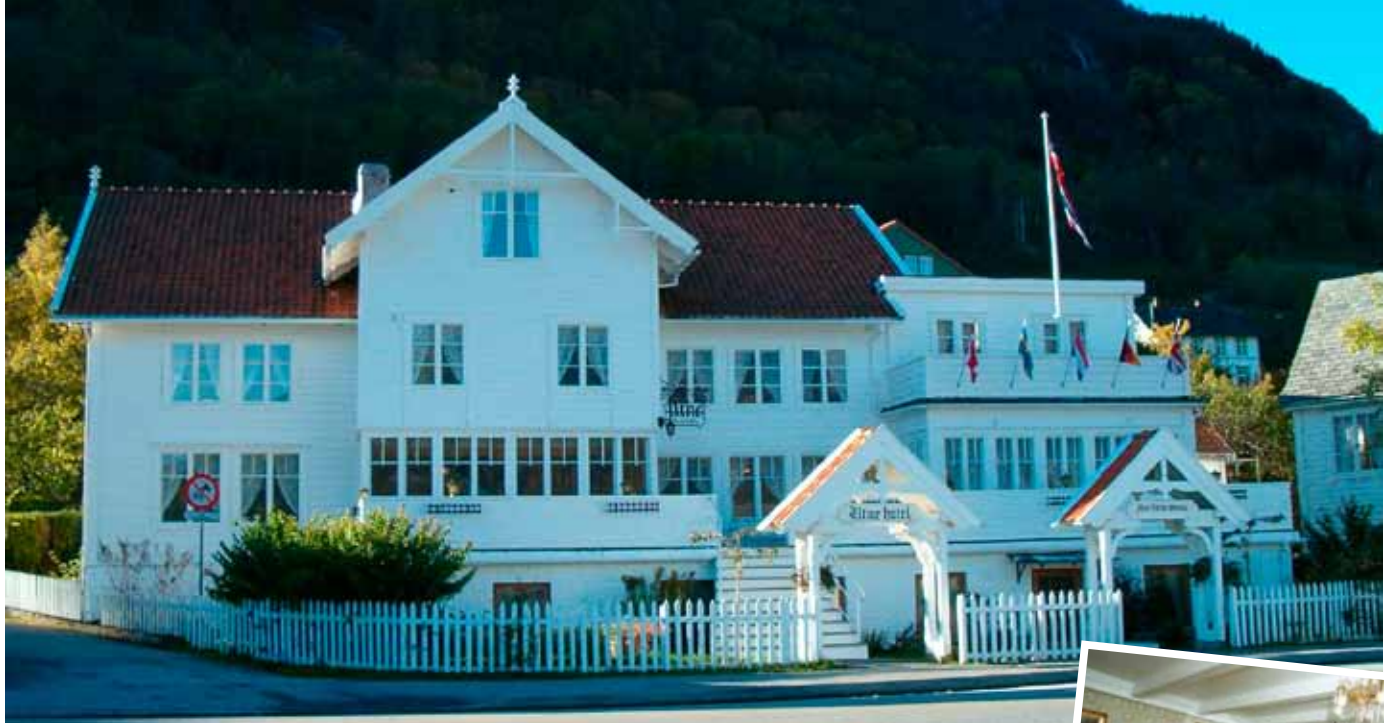
UTNE: Hotellet ligger idyllisk til ved Hardangerfjorden. Til høyre et glimt av interiøret.